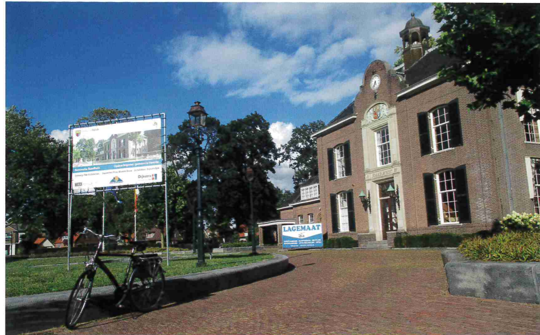
Het groene plein bij het raadhuis aan de rand van het centrum

DAT EEN PANDEMIE JE ACTIERADIUS BEPERKT EN JE DAN NAAR HEERDE FIETST VOOR EEN VERHAAL - VOELT NIET HELEMAAL GOED. HET DORP OP DE NOORD-VELUWE WERD EERDER DIT JAAR KEIHARD GETROFFEN DOOR HET CORONAVIRUS. NU IS HET AANTAL BESMETTINGEN ER LAAG, LAGER DAN IN MIJN STAD ZWOLLE. EN IK HEB EEN MONDKAPJE MET FILTER BIJ ME. ZOALS STEEDS, TEGENWOORDIG. VOOR HET GEVAL DAT.