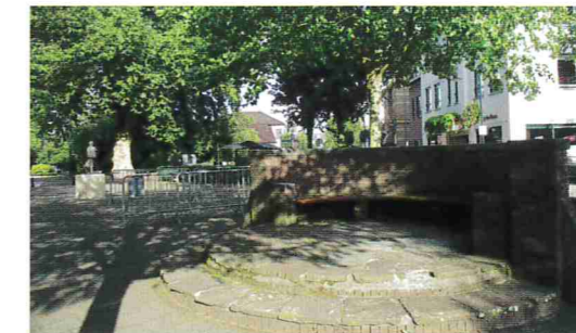
De bakstenen bank, door de burgerij geschenken. Links het beeldje van de schaapherder met hond, geschenken door de bank